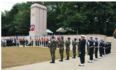
Inauguration le 8 mai 2011 du monument et du mémorial Pershing / La Fayette après les travaux de restauration et de mise en valeur des abords immédiats.

La naissance de ce monument remonte à la période de l'entre-deux-guerres: il fut érigé en hommage d'une part à l'armée américaine ayant combattu pendant la Première Guerre mondiale et à l'armée de la guerre de l'Indépendance américaine, d'autre part. Pour commémorer l'amitié franco-américaine et son aide décisive à la victoire de 1918, le Général Pershing en personne avait participé le 6 octobre 1937 à l'inauguration du monument inachevé. Réalisées en plâtre, les deux statues équestres du Marquis de Lafayette et du Général Pershing ont couronné provisoirement les socles monumentaux implantés sur la butte de Picardie à Versailles avant d'être déposées en 1941, en raison de leur état fortement dégradé par le vent et la pluie.